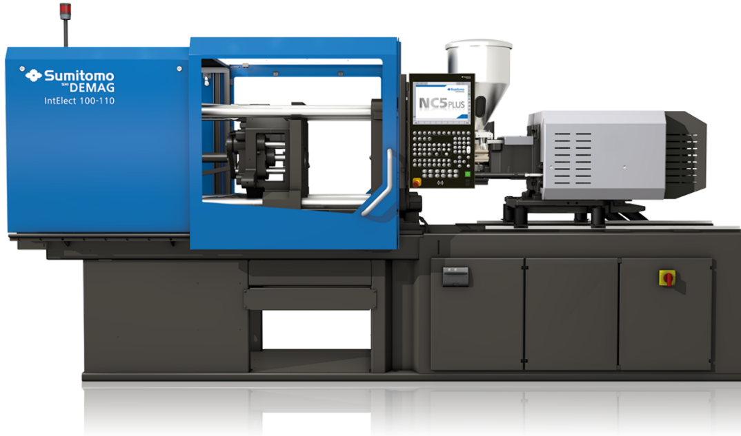
Bild 1: In der neuen Maschinengeneration setzt Sumitomo auf die BUS-unabhängige Punkt-zu-Punkt-Kommunikation IO-Link.

Die DC 24 V-Systemlösung REX12D kombiniert selektiven Überstromschutz, die Stromverteilung von Lastkreisen sowie die Überwachung, Parametrierung und Kommunikation mit unterschiedlichen Steuerungsanbindungen.