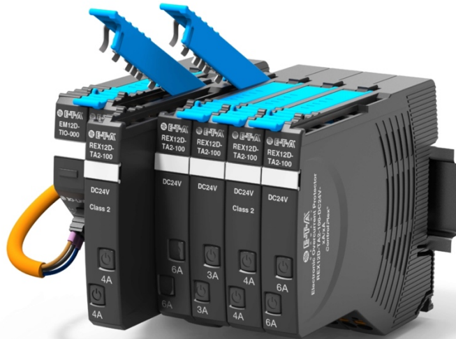
Bild 4: Am elektronischen Sicherungsautomaten des REX-Systems ist das gesamte Brückensystem bereits enthalten.